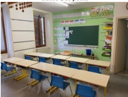
Classe primaire CP-CE1