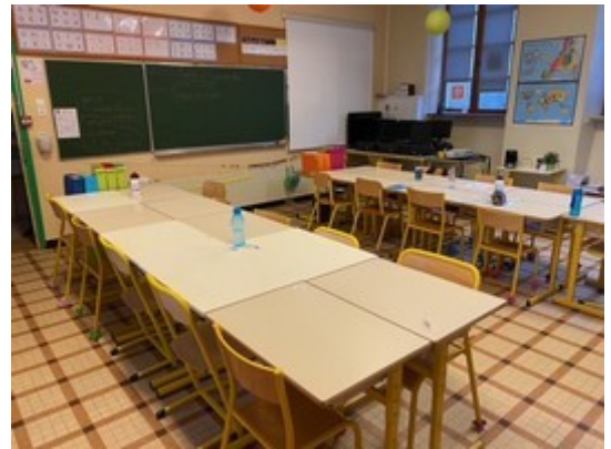
Classe des grands