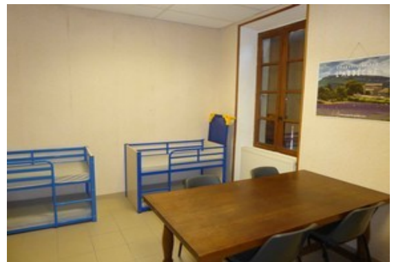
Salle de sieste