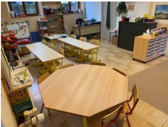
Classe Des petits