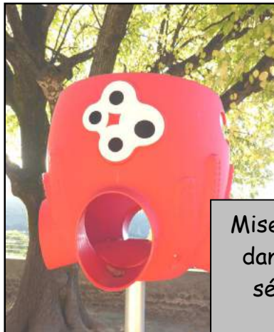
Mise en place de jeux pour enfants dans la cour de l'école et mise en sécurité des bâtiments dans le cadre du plan Vigipirate