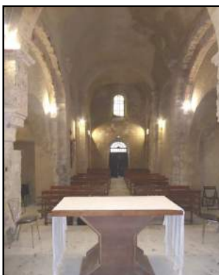
Mise aux normes de l'électricité du château et de l'église