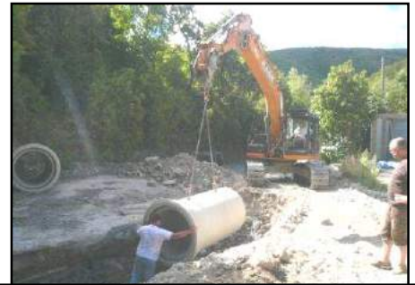
Aménagement de la route de la Rançure afin de canaliser au maximum l'eau du ruisseau du Coiron lors des gros orages