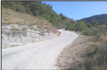
Réfection de la route du Coiron

Comme chaque année les travaux de voirie prévus ont été réalisés sur la route du Coiron, Marsac, les Combes, le chemin de la Rançure, Chante Bise, les Quatre Soleils pour un total de 65 000 €.