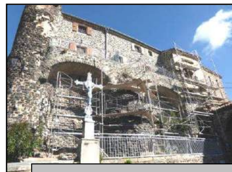
La rénovation de la façade du château a commencé